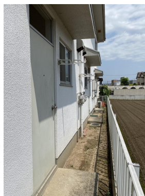
洗濯干しスペース