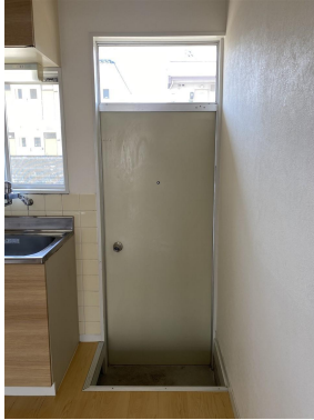
勝手口 (外に洗濯干し場あり)