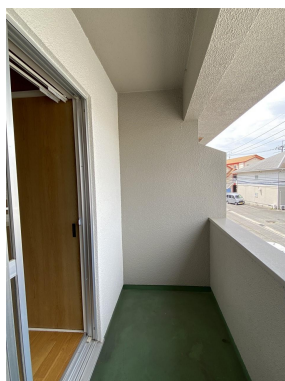
西向きバルコニー